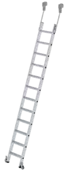
Abb. Bestell-Nr. 41412