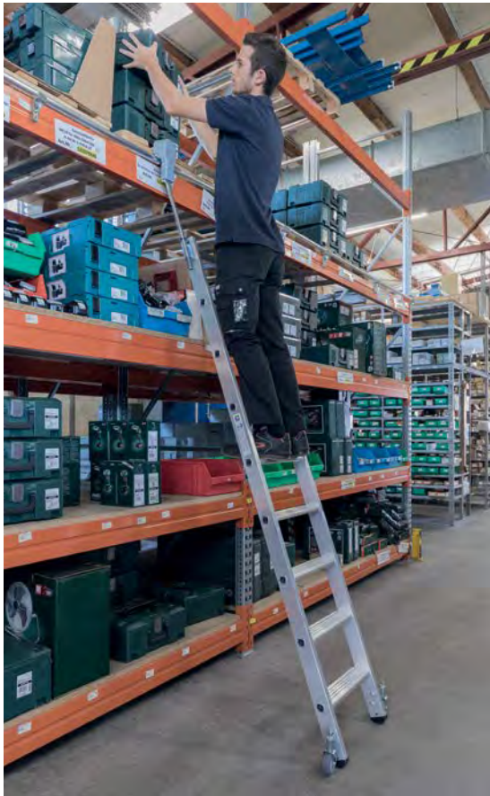
Abb. Bestell-Nr. 41408